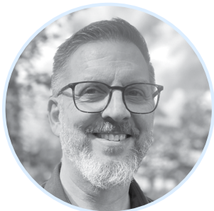
M. Stéphane Beaudoin Magon Inc. / Gestbeau Inc.