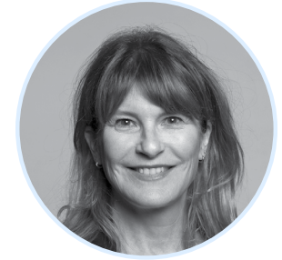
Dre Lucie Côté Institut de recherche du Centre universitaire de santé McGill